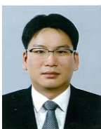
지균하 부장 카본코